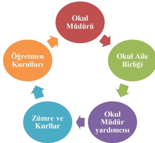
Şekil 1: Paydaş Döngüsü

Paydaş Analizi kapsamında Stratejik Plan Hazırlama Ekibi; okulumuzun sunduğu ürün/hizmetlerinin hangi paydaşlarla ilgili olduğu, paydaşların ürün/hizmetlere ne şekilde etki ettiği ve paydaş beklentilerinin neler olduğu gibi durumları değerlendirerek Paydaş Ürün/Hizmet Matrisi hazırlamıştır.